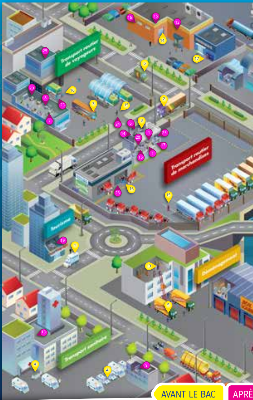
Réalisé par le Département Communication de l'AFT - Illustration & Mise en page : www.desplanetes.com - Janvier 2018